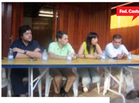
Fed. Castelo Branco

desenvolvimento do espírito federativo e a camaradagem, valores importantes para uma vida política dentro da nossa estrutura. O facto de estarem reunidos jovens de diferentes locais permitiu que a troca de conhecimentos fosse mais rica, possibilitando uma maior aproximação das regiões. Na informalidade destes momentos foi possível discutir e abordar temáticas em que todos participaram e contribuíram com a sua opinião, realçando uma vez mais o espírito democrático e plural da Juventude Socialista. Certamente que os acampamentos de verão se voltarão a repetir, a avaliar pelo sucesso que alcançaram, quer pela elevada participação de jovens, quer pela qualidade dos debates políticos e da troca de ideias.