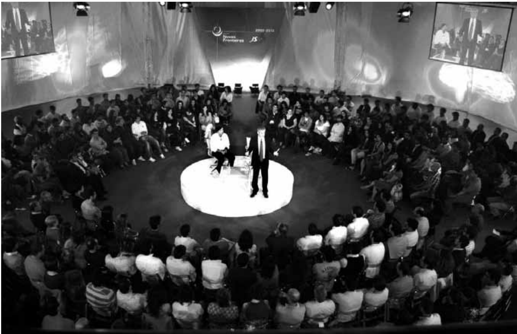
O espaço no Europarque de Santa Maria da Feira foi pequeno para acolher mais de 250 jovens do distrito de Aveiro que quiseram debater políticas de juventude com José Sócrates