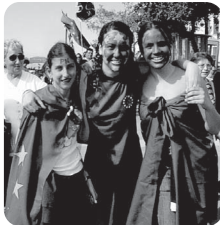
Fotografia: Festejos em Malta aquando da adesão à União Europeia

É a constatação da realidade jurídica comunitária que, por vezes,